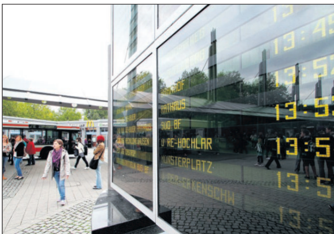
Kontrolle ist besser: Bei Fahrplan-Unsicherheiten kann ein Blick auf die Anzeigentafel hilfreich sein.

NAHVERKEHR. Wer morgen vergeblich auf seinen Bus wartet, muss nicht zwangsläufig zu spät an der Haltestelle angekommen sein. Denn ab Sonntag gilt bei der Vestischen ein neuer Busfahrplan. So fahren künftig in Recklinghausen beispielsweise die Busse der Linien 236 und 237 in Richtung Innenstadt sechs Minuten früher als bisher los. In Datteln fährt die Linie 286 ab morgen von allen Haltestellen fünf Minuten früher als gewohnt los. Auch die Nutzer der Linie 282 müssen sich auf neue Abfahrtszeiten einstellen.